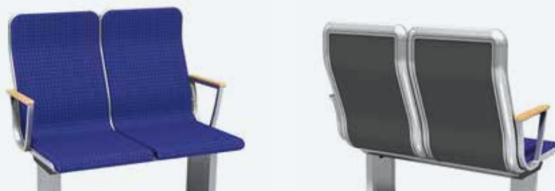
Variante ohne Kopfteil Version without headrest